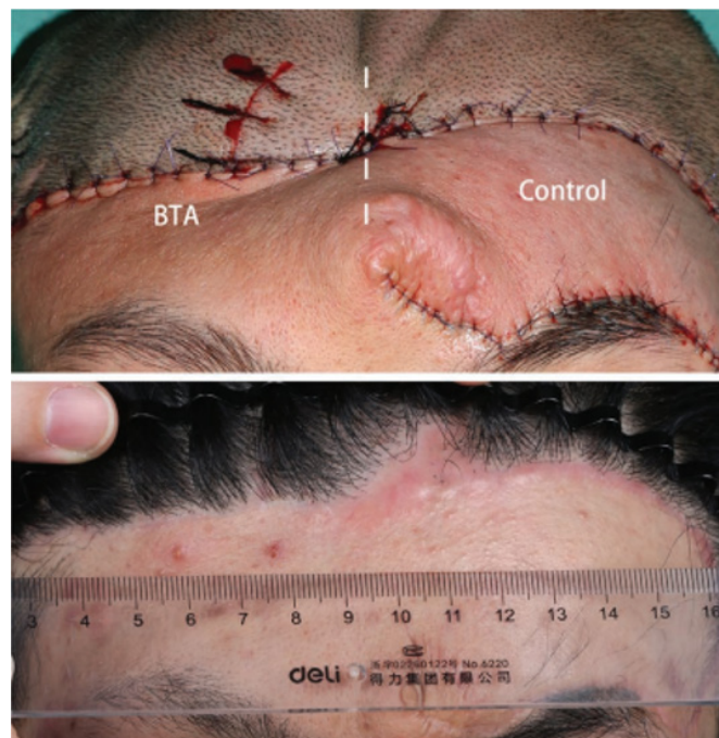
Imagen 1: Cicatriz en la línea de implantación del cabello en la frente. Inicial (arriba) y 6 meses de seguimiento (abajo). Mitad derecha de la paciente tratada con toxina botulínica tipo A y mitad izquierda tratada con solución salina normal al 0,9%.