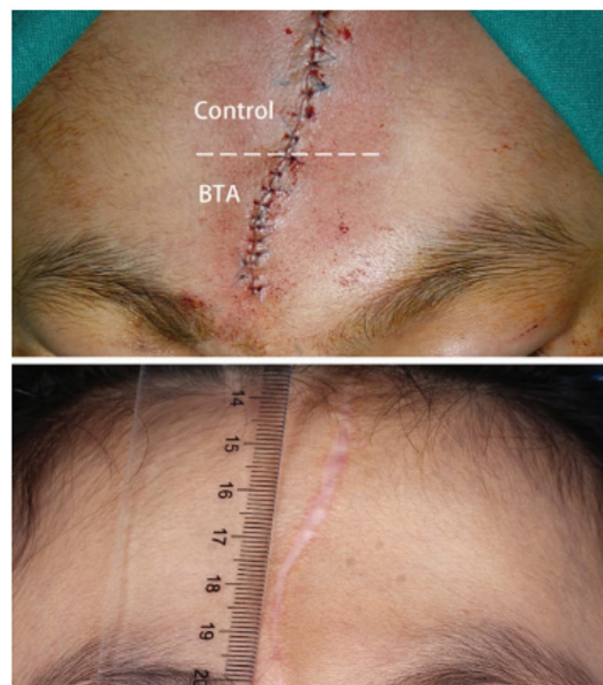
Imagen 2: Cicatriz en línea media en la frente. Inicial (arriba) y 6 meses de seguimiento (abajo). Mitad inferior tratada con toxina botulínica tipo A y mitad superior tratada con solución salina normal al 0,9%.