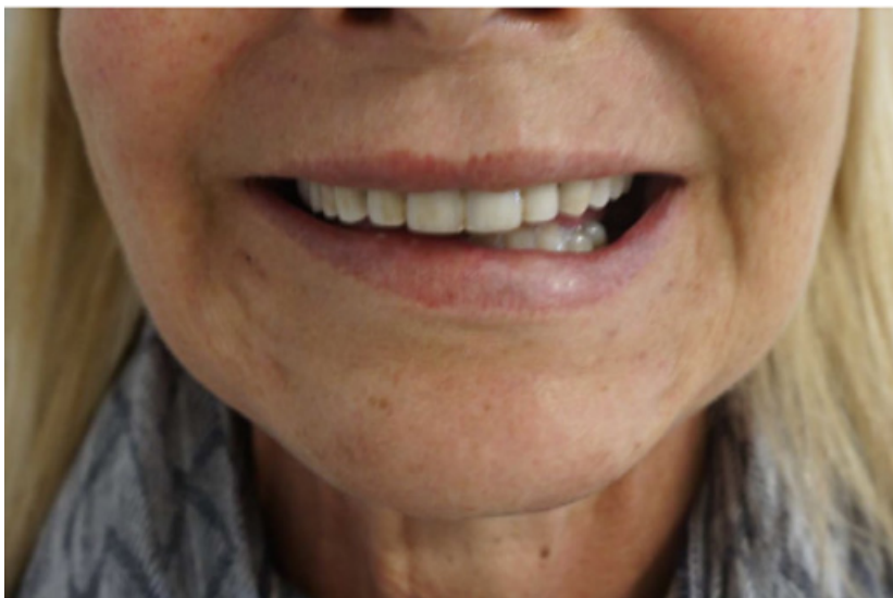
Imagen 6: Asimetría de la boca. Causado por el efecto de la toxina botulínica en el Depresor Labial Inferior derecho, inyectar el músculo depresor del Angulo Oral. Para evitar esta complicación.