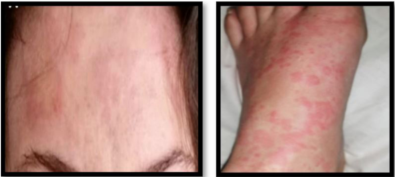
Figuras 6 y 7: Urticaria con placas eritematosas en frente y pies