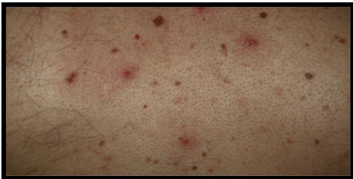
Figura 10: Papulovesículas monomorfas dispersas en el tronco