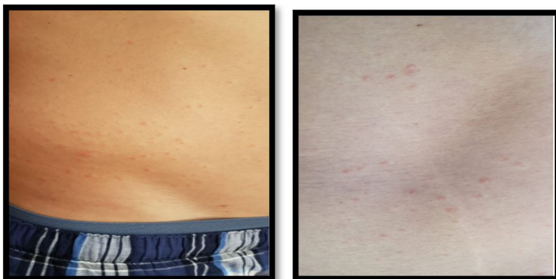
Figuras 1 y 2: Exantema Petequial y Morbiliforme Generalizado