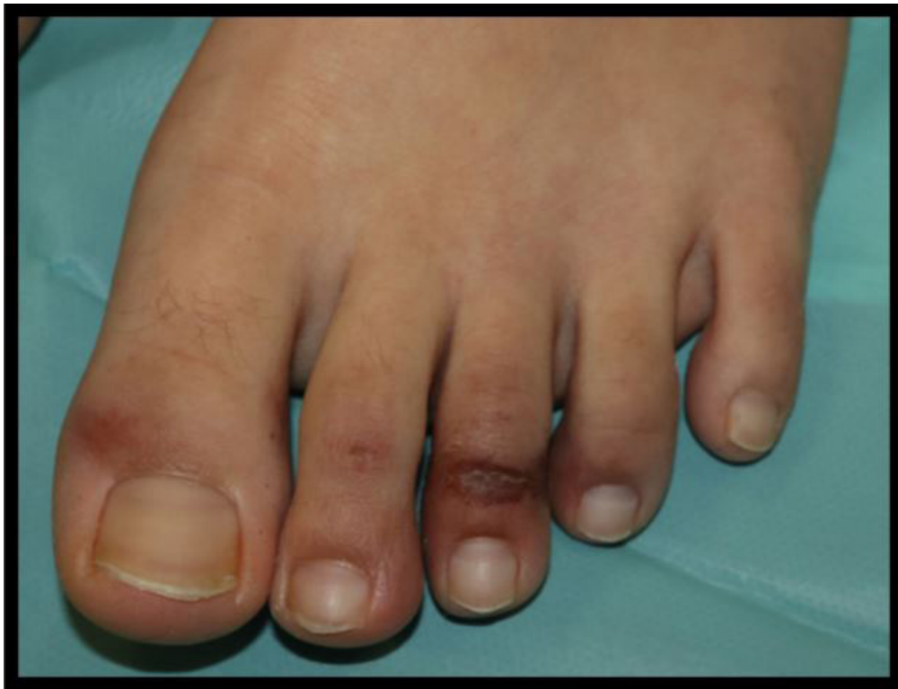
Figura 14: Pápula perniosisiforme acral

Fuente: Tomada con fines académicos de Joob B, Wiwanitkit V. COVID-19 can present with a rash and be mistaken for Dengue. J Am Acad Dermatol. marzo de 2020.