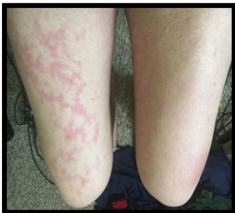
Figuras 15,16 y 17: Lesión cutánea compatible con livedo Reticularis