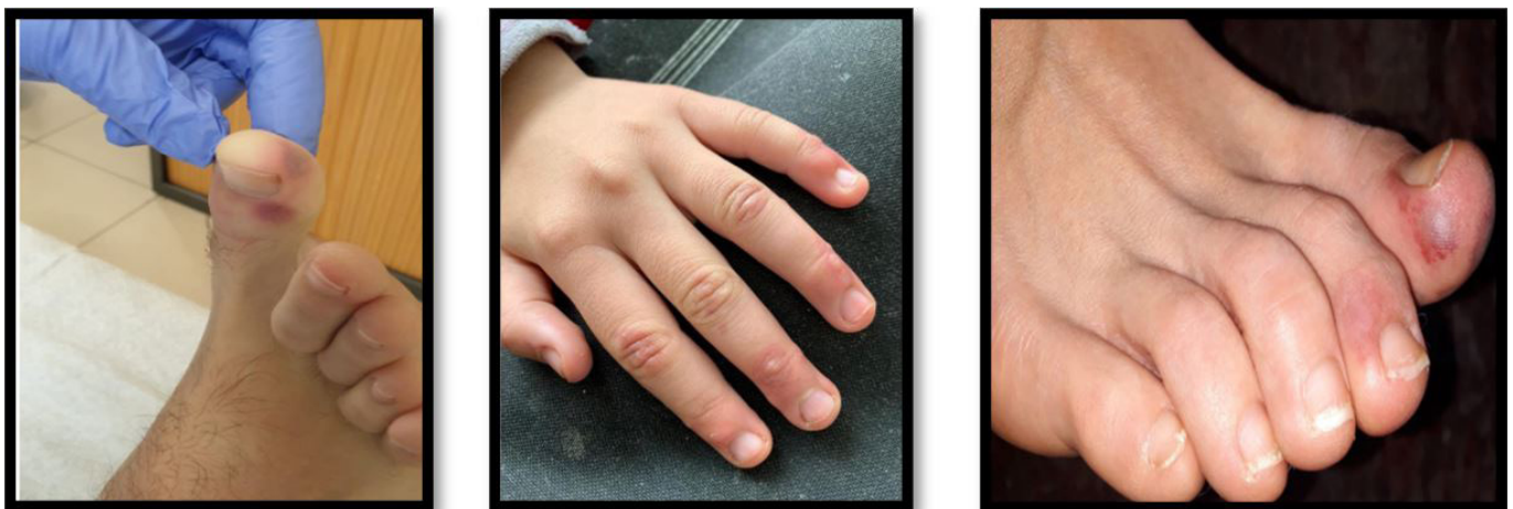
Figuras 11,12 y 13: Lesiones dermatológicas compatibles con pseudoperniosis